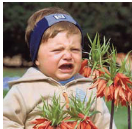
Kindern weinen nicht nur zum Trotz, sondern auch wenn's ihnen mal zu viel wird.